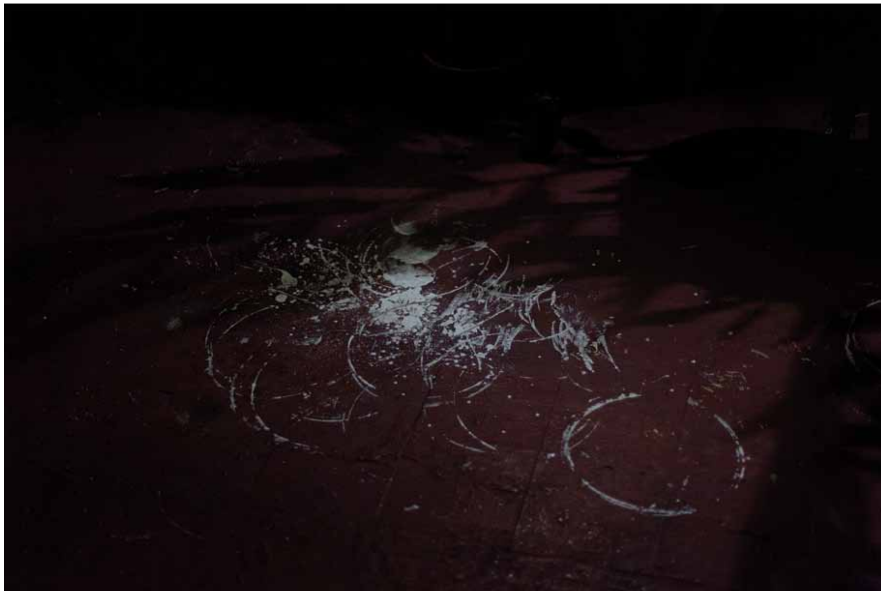
Sin título , 2013 Fotografía digital toma directa 80 x 120 cm