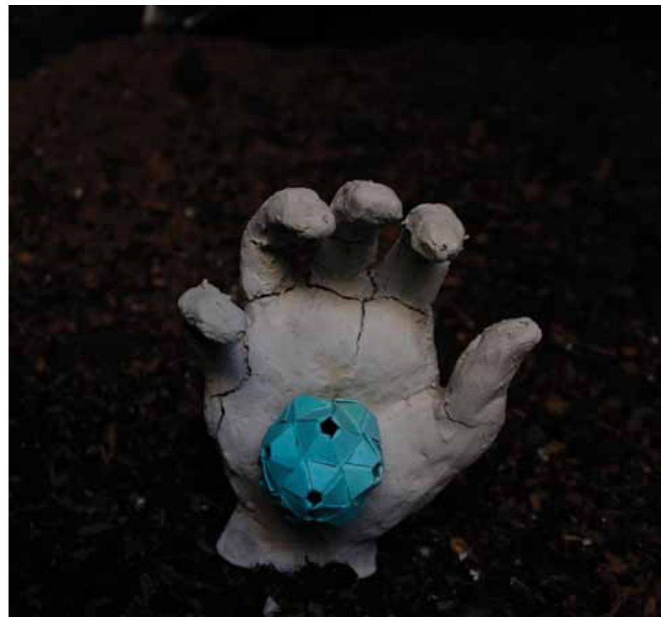
Sin título , 2014 Arcilla y origami 12 x 10 x 4 cm