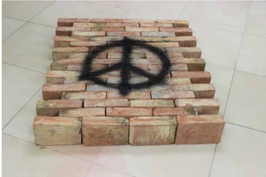
Gerald Holtom, 2014 Ladrillos y esmalte sintético Dimensiones variables