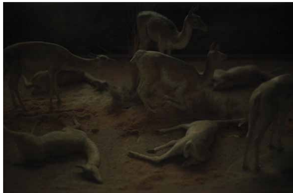
Ciencia y fe , 2014 Fotografía digital toma directa 62 x 45 cm