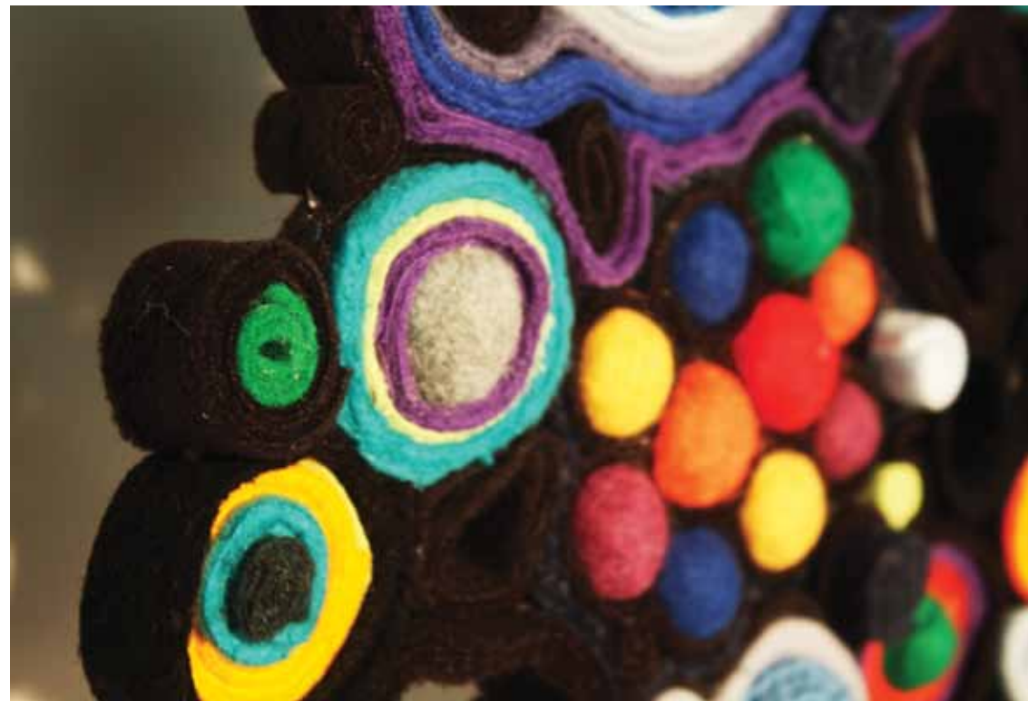
Serie Suspendidos, 2013 Dibujo textil 70 x 90 x 3 cm