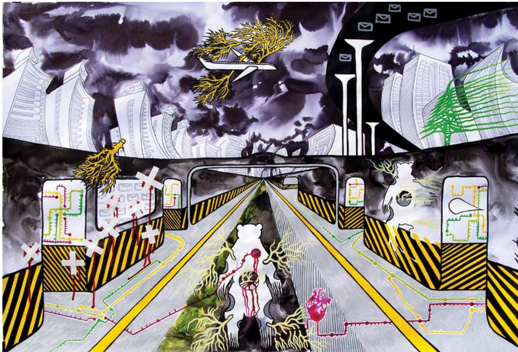
La línea Gialla , 2012 Técnica mixta sobre papel 74 x 110 cm