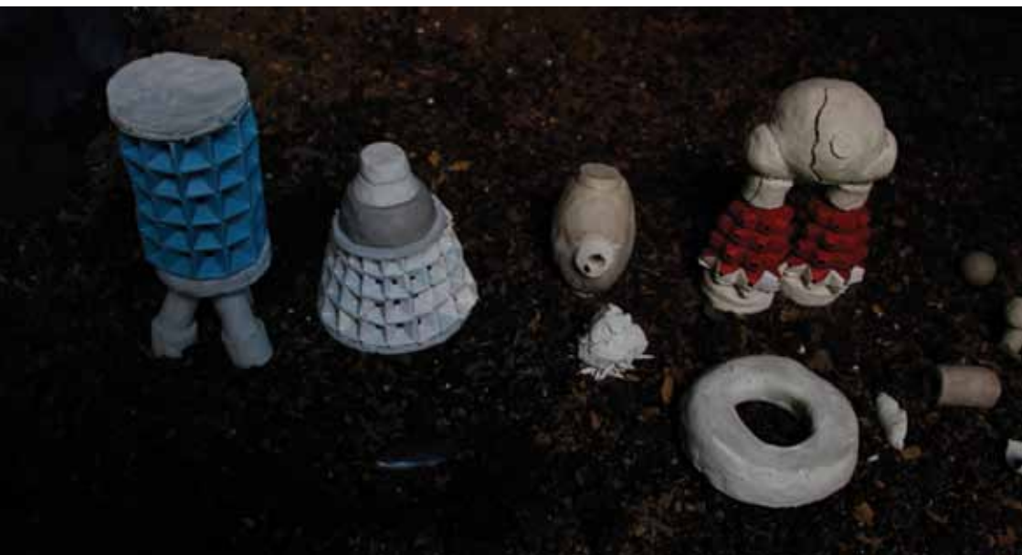
Nuevos satélites , 2014 Arcilla, origami y crochet 12 x 20 x 80 cm