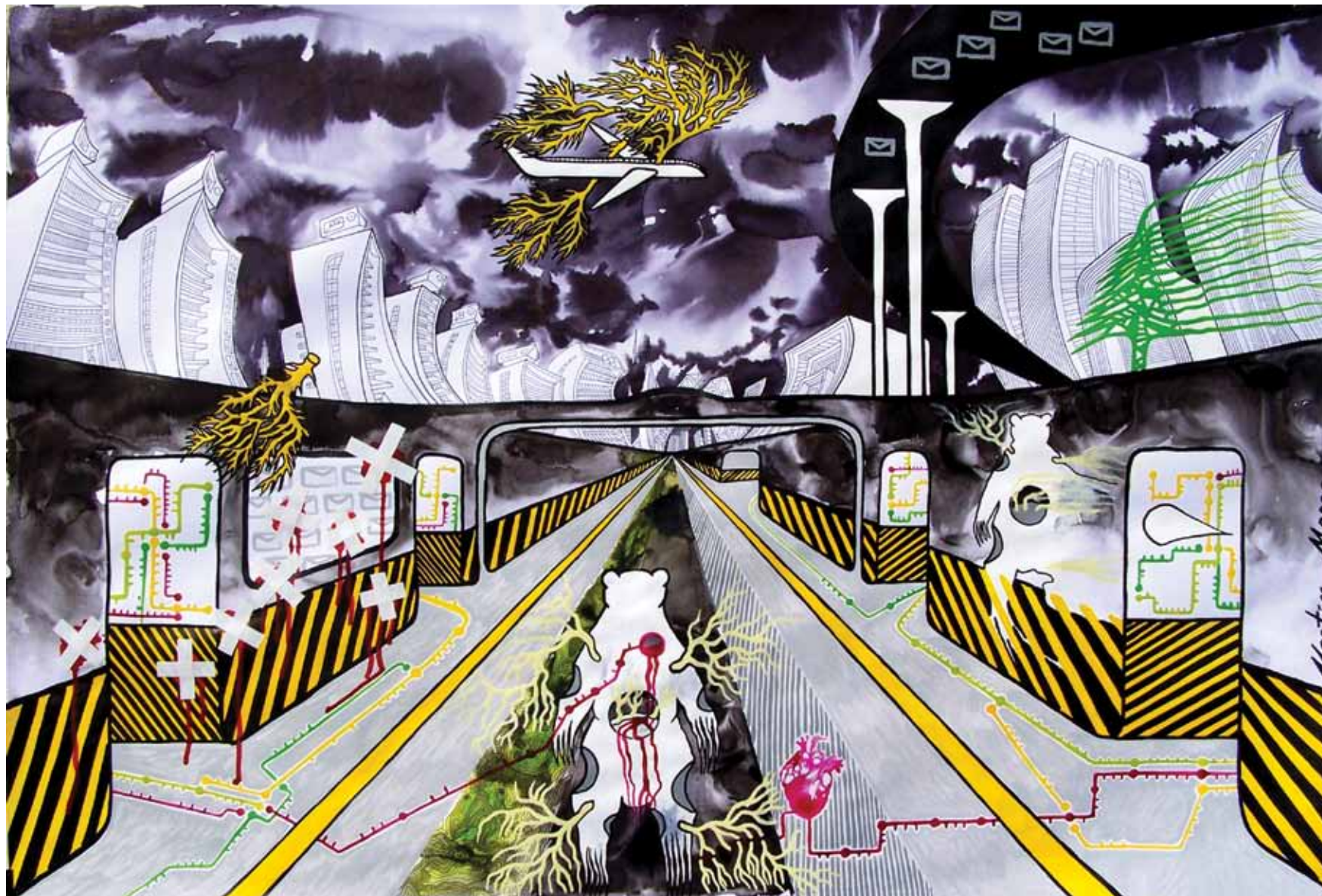
La línea Gialla , 2012 Técnica mixta sobre papel 74 x 110 cm